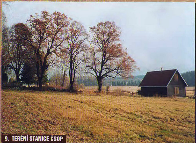
9. TERÉNNÍ STANICE ČSOP