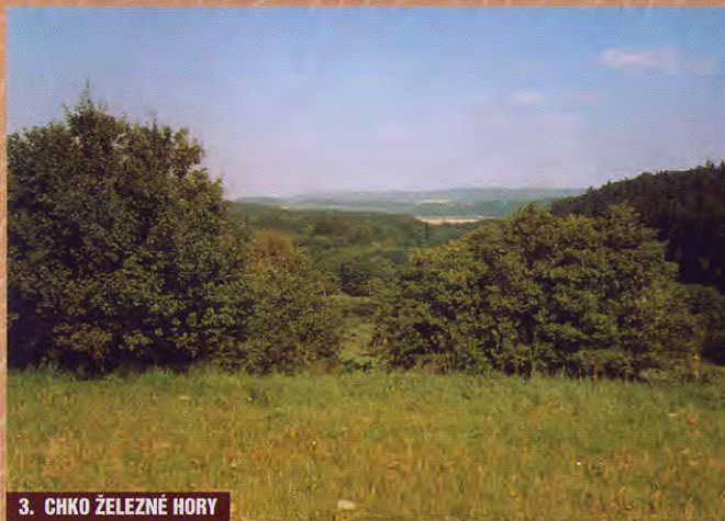
3. CHKO ŽELEZNÉ HORY