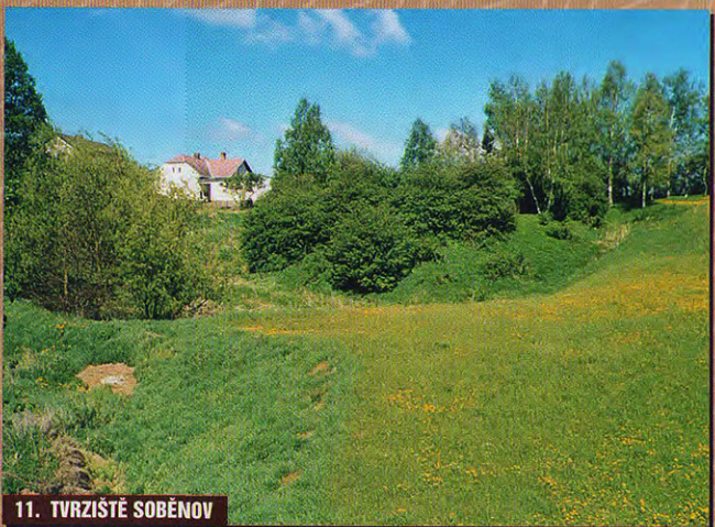
11. TVRZIŠTĚ SOBĚNOV