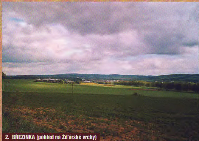
2. BŘEZINKA (pohled na Žďárské vrchy)