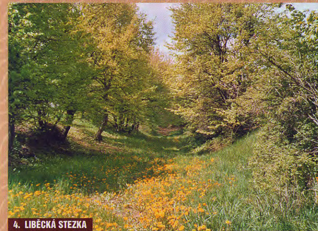
4. LIBĚCKÁ STEZKA