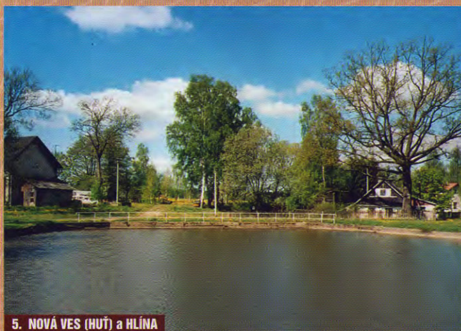
5. NOVÁ VES (HUŤ) a HLÍNA