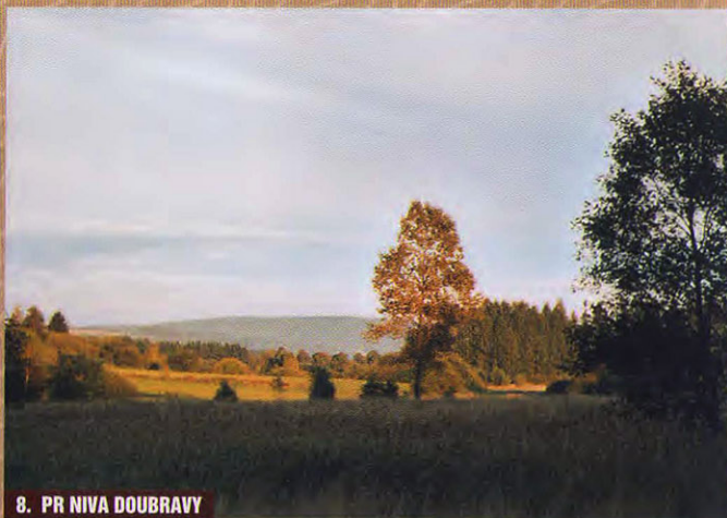
8. PR NIVA DOUBRAVY