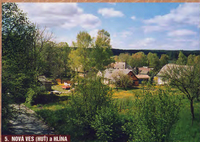
5. NOVÁ VES (HUŤ) a HLÍNA